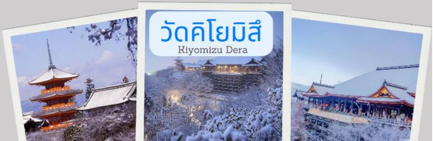
วัดคิโยมิซึ Kiyomizu Dera

จากนั้นนำท่านเดินทางสู่ เมืองเกียวโต (Kyoto) เมืองซึ่งเคยเป็นเมืองหลวงของประเทศญี่ปุ่นในอดีต ร่มกว่า 1,100 ปี จึงทำให้เมืองเกียวโตแห่งนี้ มีสถานที่สำคัญๆ ที่เต็มไปด้วยประวัติศาสตร์ และ วัฒนธรรมดั้งเดิมของญี่ปุ่นมากมาย จากนั้นนำท่านสู่ วัดคิโยมิซึ (Kiyomizu-dera) หรือ “วัดน้ำใส” เป็นวัดเก่าแก่บนเนินเขาที่มีอายุเก่าแก่กว่าตัวเมืองเกียวโต ตัววัดก่อสร้างด้วยไม้เกือบทั้งหมด แต่ที่น่าสนใจ คือ เสาที่ค้ำยันระเบียงวัดขนาดใหญ่ ประกอบไปด้วยเสาไม้จำนวนร้อยกว่าต้น สูงจากพื้น 12 เมตร โดยไม่ใช่ตะปูแม้แต่ตัวเดียว โดยใช้วิธีเข้าลิ้มด้วยภูมิปัญญาของชาวญี่ปุ่นโบราณนั่นเอง จาก ระเบียงแห่งนี้สามารถถ่ายภาพ ณ จุดที่สวยงามที่สุดในกรุงเกียวโต มองเห็นวิวทิวทัศน์ของตัวเมืองเกียวโต ได้งดงามพร้อมกับวิหารของวัดคิโยมิซึ