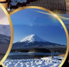
สวน โออิชิ พาร์ค

ราคา เริ่มต้น 55,919 บาท รวมภาษีมูลค่าเพิ่ม 7%