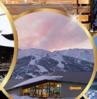
Snow peak land hukuba