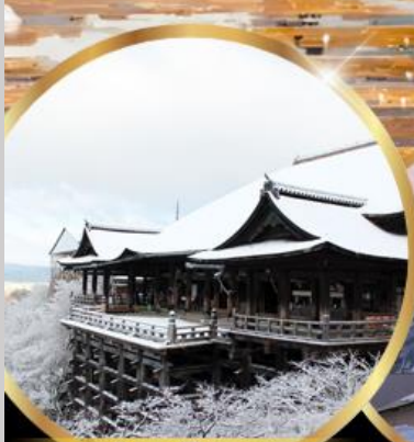
วัด คิโยมิสึ